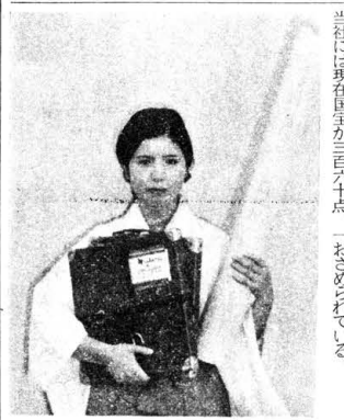
(写真はフィルムと設計図)

設計図は、この度の復興の全体計画を永久保存し、後世に伝える。カプセル、三斗、全巻をフィルムカプセル形式にして、御神設計図を永久保存する。