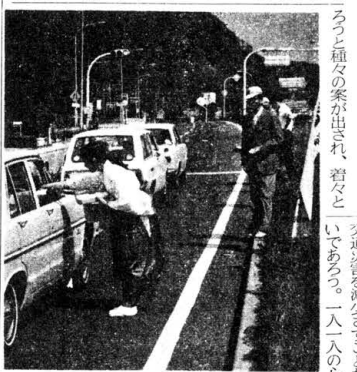
秋の交通安全週間が九月十二日から十日間満了一斉に展開された。

第一日目の二十日、当社、宗像警察署、宗像郡交通安全協会が一本となった交通安全協会が八十八の城山警察交差点に於て、通行車に安全運転を呼びかけ、