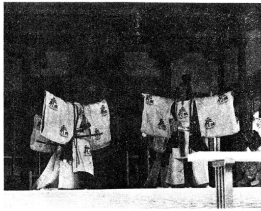
宗像大社では、昨年の秋大祭 大齋行することになった。