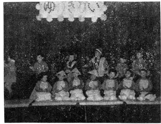
ゆづがき 三月十日、卒園も近い田島の幼稚園で「ゆづがき」が開催された。坊主頭やオカッパが可愛い遊戯を披露した。見物のお父さんお母さんたちを前にして溢るばかりの喜ぶ演劇に盛んな拍手がわき起こった。