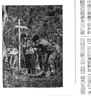
宗像高校生 新縦走路を開発 宗像のすぐれたハイキングコースとして、四つ塚連山縦走路の計画が宗像市に...