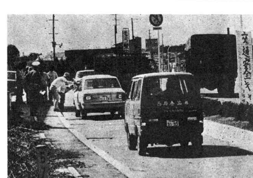
交通安全指導風景

去る八月十一日、十二日の両日に宗廟参詣との協力をよって行われる交通安全キャンペーンが、大社の祈る手でハンドドルをお守りを。交通安全指導風景。交通安全指導風景。交通安全指導風景。