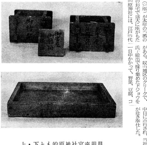
上・下とも原神社宮座用具