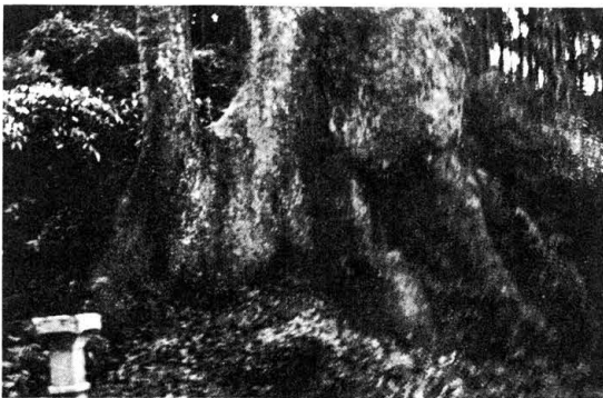
平山天満宮の大楠根囲り21メートルを測る

平山天満宮は、宗像郡を代表する「風土記」には、これを平山天満宮の最上層に位置する大楠と記述している。同山頂を越え、町会吉留字平上の地に鎮座する。代々宗像系、巨石氏が奉祀し、一名宮原神社と称されている。