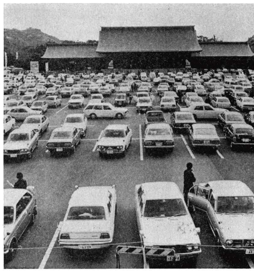
参拝車輛で埋った大駐車場

昭和五十七年元旦、午前零時 神門が左右に大きく開かれ、 拝殿の大盆が打ちなされ、 神樂の大庭舞が一段と火の粉を高く くする、津清・博久入の願、こ こに紀元二千四百年、壬戌 の年は黎明を迎えた。 黎明は手で降り続く雨も この年明けを待っていたかのように、 あがり、夜は曇天の星が美し い。 神樂に元々ある拍手の音、新 年の挨拶、本殿中心に開演未社 に盛られた神樂の美しさ、ポー ンと浮び来る参拝者の晴姿、数 時間前の静寂がその様である。 本、拝殿前、いはば参拝者の 中、NHKのカメラマンが、 マクロロに人々に今年年の 抱負をインタビューして来る。 NHKラジオ放送による、一ひく 年への年の言葉が流れて、当