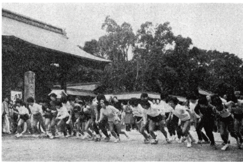
神門前スタート (女子2kmの部)

初春の二十四日、福岡・北九州都市圏ですっかり定着した宗像マラソンの第十五回大会が、海沿いの折り返しのコースを行なわれ、神前に着近しをうける物マラソンで、今年は四百七十五名