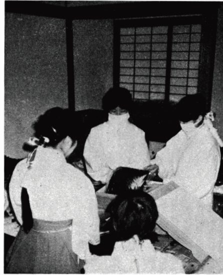
巫女の手で奉製されるわかめ