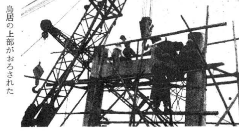
鳥居の上部がおろされた