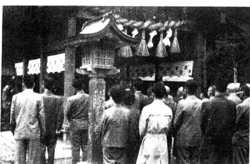
沖津宮現地大祭の様子