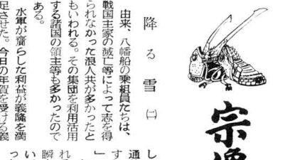
宗像四郎氏貞 (田) 山下半可作