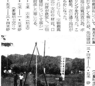
宝物館建設用地の様子