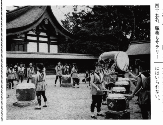
「むなかた太鼓」であるが、地域文化の核の一つとして今後の益々の活躍を願わずにはいられない。

続いて揃いの衣装に身を包み、正午から午後一時過ぎまで、二十分間の演奏を二度披露した。団員の糸乱れぬ鮮やかなパチパチと、琴線に触れる太鼓の音に、観衆は盛んに拍手を送っていた。