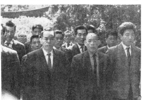
この写真は、醸造報賽祭齋行の様子を捉えたものである。