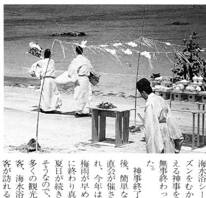
夏祭りの花火大会の様子

六月十日・十七日の両日、当天社清朗殿・齋館に於て第十五回全国かるた競技宗像大社大会が開催された。 三十一文字を綴る和歌は、万葉集・勅撰和歌集を始め、幾千首とあるが、この中より京極の中納言・藤原定家が選び定めた百首が「小倉百人一首」と呼ばれ、かるた競技宗像大社大会は伝統文化の継承と、青少年の情操教育の一環として昭和五十一年、当天社昭和御造り當記念神賑行事として始まる。