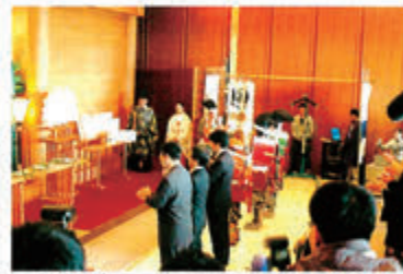
玉串拝礼をする一同