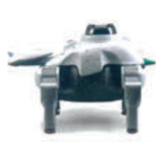
家庭用ユーティリティ ロボット 番竜