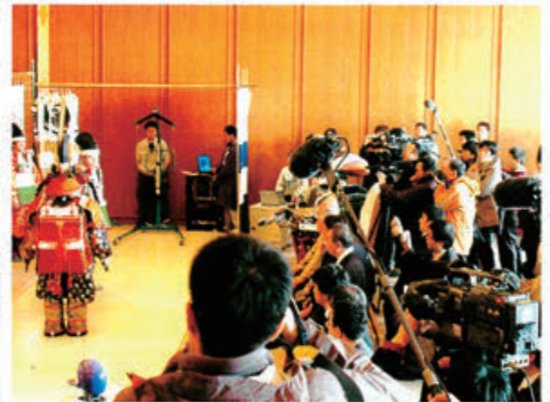
見事二礼二拍手一礼をし、退出する「キヨモリ」

ロイター・タス通信といった世界への配信社、海外のメディア約六〇名が押し寄せ、まるで有名な会見のようなか祈願祭が斎行された。