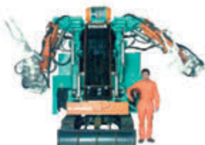
レスキューロボット 援竜