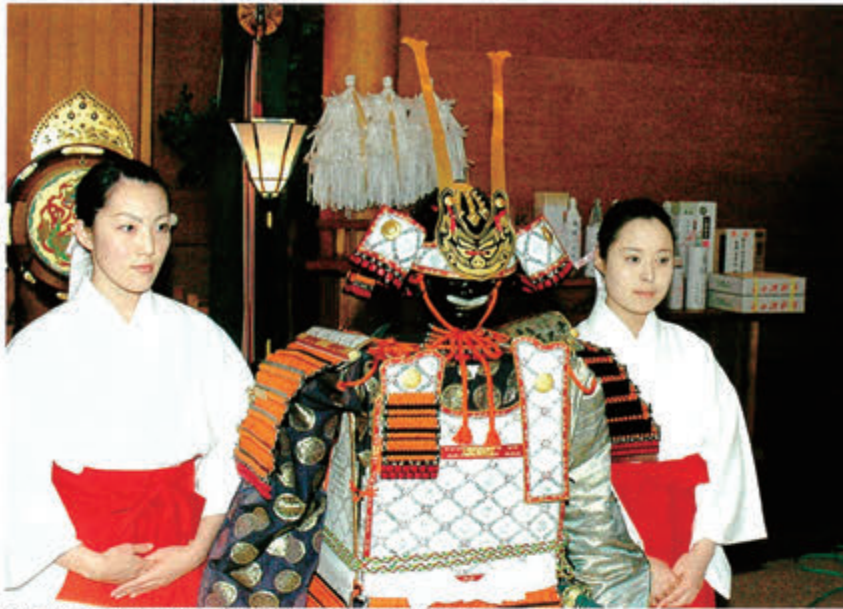
当大社 巫女らと、撮影に応じる「キヨモリ」(祈願祭終了後)

十二月十二日当大社祈願殿で、北九州市に本社を置く「テムザック」が開発した、新型二足歩行ロボット「キヨモリ」が鮮やかな甲冑を身に纏い、同社がこれまで開発してきた八台のロボットと共に参拝し、ロ