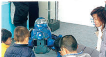
子供たちと触れあうロボットたち(前日のイベントにて)

い中、家族連れを中心に多くの方がロボットと触れ合っていた。未知なる世界へ果敢に挑戦し、技術力の絆を結集されたこのキヨモリはロボット開発技術力の向上と、テムザックのフラッグシップとなるのは勿論、今後の新しいモビリティの形となりうるロボットの先導役を担っている。宗像大神様の御加護をいただき、(株)テムザックのロボット産業への想いと、人間社会への貢献を願いつつ、日本で生まれた新しい「ロボット文明」が世界に羽ばたいていくことを御祈念申し上げます。