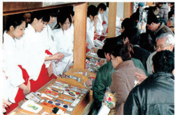
新しい御守・御札を求め賑わう授与所