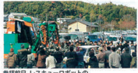
参拝前日、レスキューロボットのデモンストラーションに見入る参拝者ら