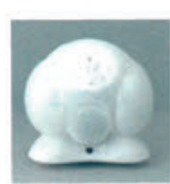
家庭用留守番ロボット ロボリア

北九州市小倉北区木町1-7-8 TEL 581-3520 URL www.tmsuk.co.jp