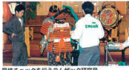
最終チェックを行うテムザック研究員(前日の午前零時です)。