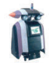
屋外対応型 巡回警備ロボット ムジロー