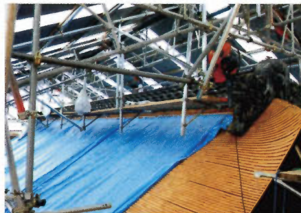
■拝殿に鬼瓦・棟瓦が取り付けられました。背面側の鬼瓦は亀裂の修復、棟瓦は積み直しをしました。

時満ちて道ひらく 造営日記 ⑨ 工事完了まであと四ヶ月となりましたが、予定通りに進んでおります。 八月には神宝館に於いて、辺津宮本殿・拝殿修復工事業者ご協力のもと、屋根の仕組みや塗装についての造営展を行います。