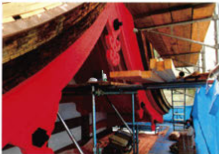
■本殿妻部分の丹塗りは2回目の上塗りが行われ、前回同様の配合で仕上げられました。