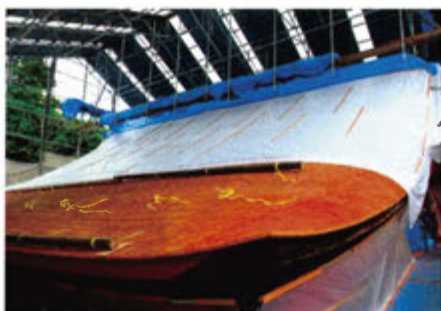
■しかし、7月10日に九州南部に上陸した台風8号の影響で工事は一旦ストップとなり、素屋根ネットの開放、ウエイトを設置し急遽台風に対応しました。

取り、連覇を果たした。 今回の大会は参加者が過去最多ということもあり、会場は大変混雑したが、大会関係者、選手の協力により三日間とも滞ることなく終了することができた。閉会式後には、選手等は互いに健闘を称え合い、来年の再戦を誓い大社を後にした。