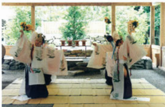
た姿をご覧いただくため、今後も温習を重ねて更なる研鑽に励みたい。