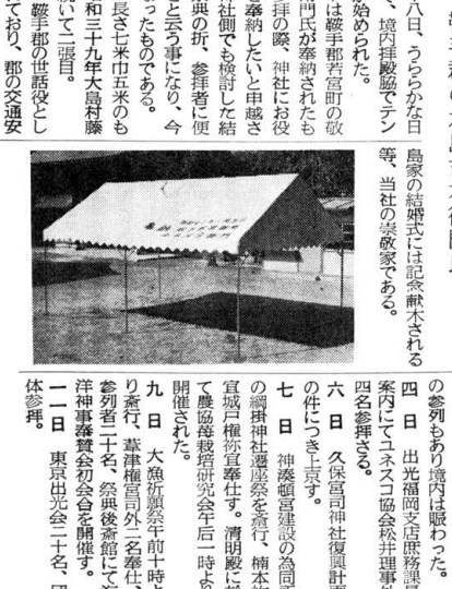
鳥家の結婚式には記念献木される等、当社の盛衰である。