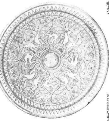
この鏡によく似ている鏡は、ベトナム国立博物館の中国鏡。次に、東京国立博物館の中国鏡がある。

神鏡の巻 (下) この鏡は、もつ完全な鏡造に成功していたならば、舶載鏡(はくざい)といつても疑われない程、鏡の構造の美事さ、図案の抽出の優秀さを持っている。しかし残念なことに鏡が、悪いばかりに粗雑な鏡として見られることである。 これまで学者の一般に、仿製鏡(ばくせい)の中には、雙鳳鏡はないといわれていたが、神島出土のこの鏡も前述のように、構圖、図案の優秀さや、中国鏡に多く使われる銘文(又文字)も有る点等から、仿製鏡であらうと考えられる節もある。しかし、この雙鳳鏡は、日本独特の三角縁の使用と、部類の鏡には使用しない銀鍍文帯