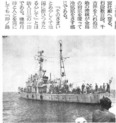
沖津宮大祭の舟渡り風景