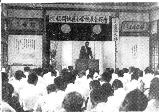
写真は清明殿で研修する校長先生

この後、当社久保岡から宗像大社と宗像と題する講演があり、宗像神の総本宮として、三宮が一体であるお社と、宗像郡は