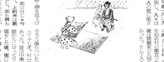
宗像神社の伝説に登場する人物のイラスト。