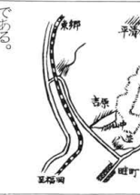
宗像郡の地図。宗像神社の位置が示されている。